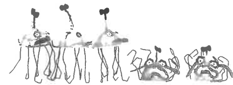
えんえん! えんえん!